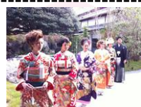
【木斛亭 美食倶楽部】

イベント当日まで、必要に応じて打ち合わせを行い、内容をご提案。マニュアル、台本の作成から、当日のディレクション、MC(司会者)、スタッフの手配まで対応いたします。お気軽にご相談ください。