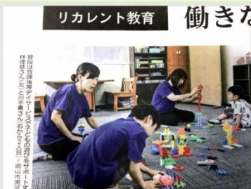
(2019年10月20日熊本日日新聞参照)

仕事をしながら勤務の前後や休日などを使い、あるいは休暇を取って専門的な知識や技術を習得して自身のキャリアアップや自己研鑽を図る「リカレント教育」の機運が高まっています。終身雇用制度が壊れつつあり、人生100年時代と言われる中で、企業や自治体、国は個人の学びを後押ししています。