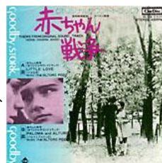
赤ちゃん戦争～ オリジナルサウンドトラック [キャニオン/Cine Disc M-24]