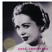
驚異のコラトゥーラ・ソプラノ / アラ・ソレンコワ [GRAND SLAM RECORDS GS-2042]

アラ・ソレンコワは旧ソ連で活躍した往年のソプラノ歌手。現在入手できる音源はほぼ皆無で、幻の存在。1956年(一説には57年とも)にボリショイ劇場の専属歌手となった彼女は、57年秋に来日し、全国で13公演を行った。実はこの日本滞在中に彼女は計13曲をスタジオにて録音。それらはアルバムとして新世界レコードから発売された。その音源が全曲完全な形で、更に貴重なボーナストラックを追加してCD化。彼女の歌声は「水晶」に例えられるという。すなわち「あたたかみのあるきらめき」。技巧を駆使したコロラトゥーラだが、決して耳障りにならない柔らかな響きは彼女ならではの一言。