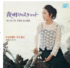
夜明けのスキヤット ／由紀さおり [EMI TOCT-26686]

ご存知由紀さおりの、1969年に発表されたファーストアルバムが、ボーナストラック6曲を追加してCD復刻されている。姉の活動に影響を受け、幼くして本名の安田章子名義で童謡歌手として活躍。その後ポップスシンガーとしてデビューするも不発。そんな不遇の時期に、ラジオのテーマ曲としてスキヤットで歌い上げたのが、「夜明けのスキヤット」の原曲。もともとレコード化の予定はなかったが、問い合わせが殺到する事態となり、急遽この「夜明けのスキヤット」で再デビューすることに。結果、150万枚を売り上げる大ヒットとなり、一躍スターダムへと駆け上がった。そのタイトル曲をひっさげて制作されたのが本盤。その他はほぼカバー曲で埋め尽くされており、いかにも当時のアルバム作り方だ。ここから彼女は、持ち前の歌唱力を武器に、日本歌謡界に君臨し続けることになる。