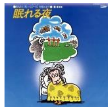
眠れる夜 / 松武秀樹 [EMI/ブリッジ EGDS-33]

のちにアンビエント、チルアウトなどと括られるゆったりとした電子音楽が流れる中、ナレーションが「羊が1匹…羊が2匹…」と、約43分間に渡って延々と続く。聴いてるうちに眠くなるでしょ、というコンセプトだ。一体何匹まで数えているのかは聴いてのお楽しみ。ちなみにリスナー自身が羊を数えることのできるカラオケも収録されている。